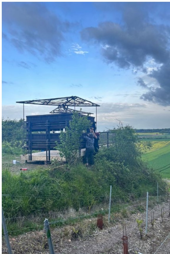
Ilustracja 7. Lodge „Le Pressoir”.