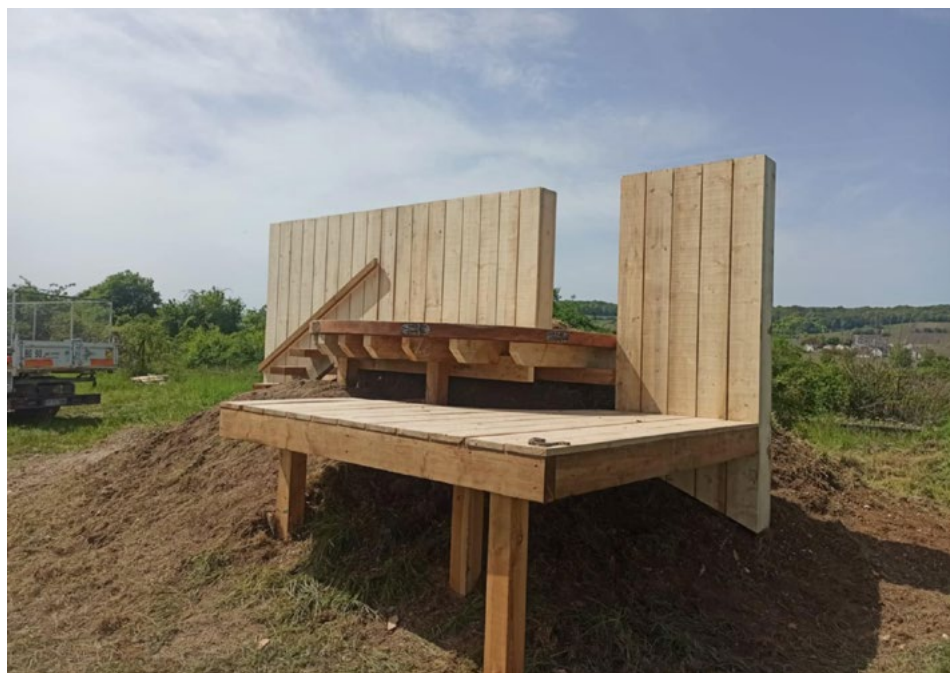
Ilustracja 5. Lodge „Horizon Hérité w Avize” . Fot. Aleksandra Trojnar