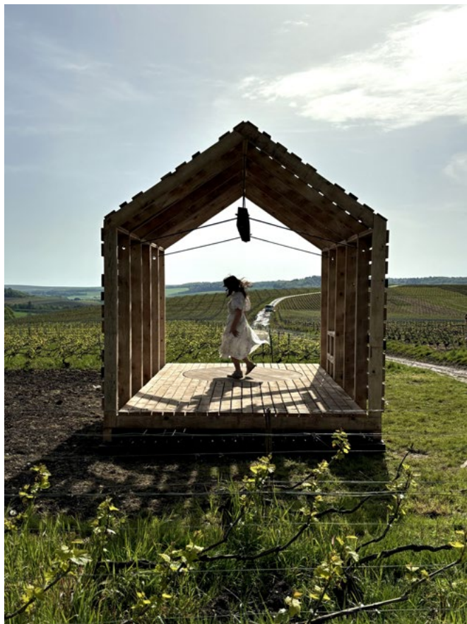
Ilustracja 6. Lodge „Coup de Foudre w Avenay-Val-d’Or”.

Celem projektu było oddanie hołdu tradycjom winiarskim i podkreślenie ich znaczenia dla mieszkańców regionu. Forma lodge inspirowana jest kształtem tradycyjnych chat, w których winiarze spędzali czas, doglądając plonów. Projekt łączy w sobie nowoczesne rozwiązania z elementami historycznymi [...]. Szczególnym odwołaniem do historii jest belka umieszczona pod sklepieniem, która nawiązuje do poziomej belki z dawnej prasy winiarskiej, na której zamocowana była prasa. Warsztaty były okazją do rozwinięcia naszych umiejętności w praktyce oraz do zawarcia nowych przyjaźni. Poznaliśmy niezwykłą historię oraz oddanie mieszkańców dla pielęgnowania tradycji winiarstwa Szampanii. (Joanna Mikołajec) (il. 6).