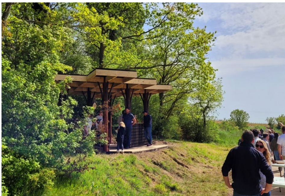
Ilustracja 9. Lodge „La Roseraie” .