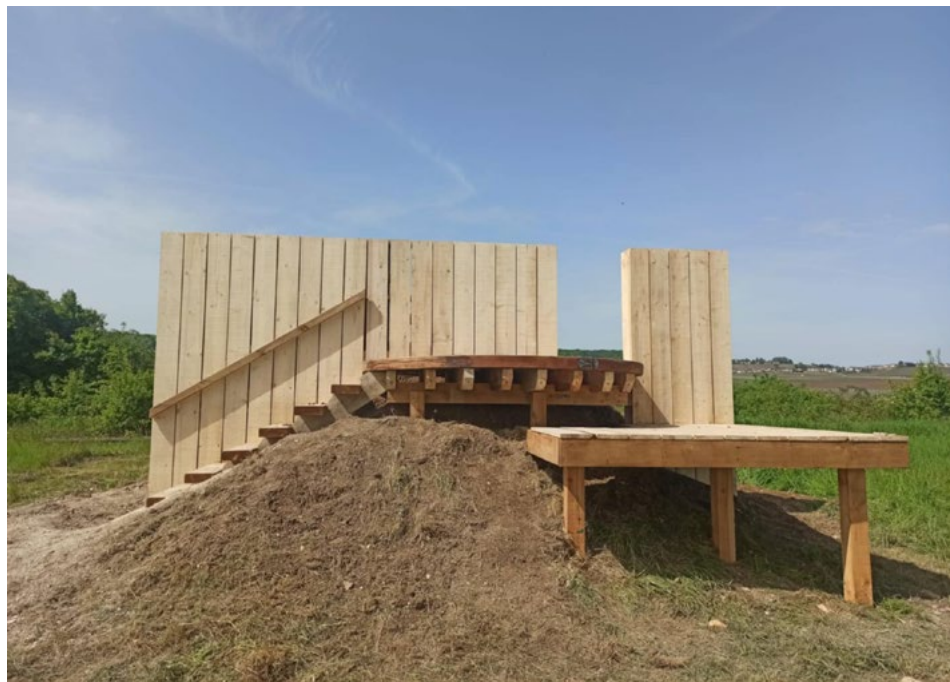
Ilustracja 4. Lodge „Horizon Hérité w Avize” . Fot. Aleksandra Trojnar