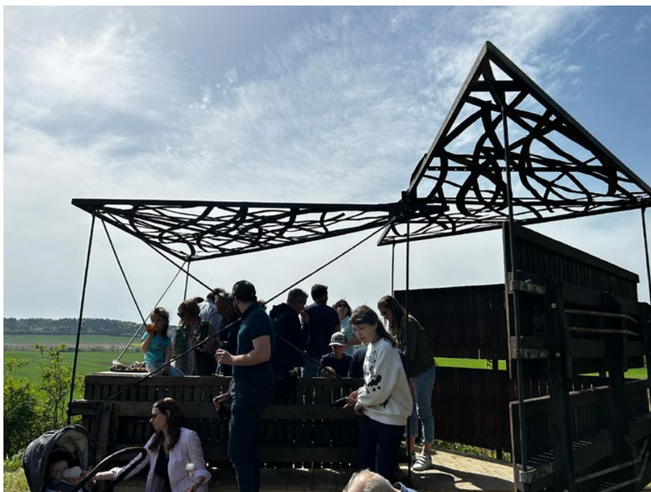
Ilustracja 3. Uroczysta inauguracja lodge „Le Pressoir”.