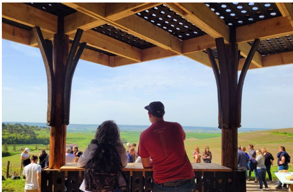
Ilustracja 2. Widok z lodge „La Futaie”.

Od chwili rozpoczęcia działań w 2017 r. powstało 28 nowoczesnych lodge , zaprojektowanych i zbudowanych przez studentów. Każda z tych struktur została harmonijnie wkomponowana w krajobraz, łącząc się z otoczeniem. Tworzone obiekty są nie tylko estetyczne i funkcjonalne, ale także przyczyniają się do wzbogacenia lokalnego krajobrazu. Studenci, którzy projektują i własnoręcznie wykonują te mikrostruktury, nie tylko rozwijają swoje umiejętności praktyczne, ale także uczą się wrażliwości na lokalny kontekst, przywiązując wagę do ochrony krajobrazu i dziedzictwa kulturowego. W efekcie projekt ten i powstające w jego wyniku lodge łączą w sobie historię, tradycję, innowacyjność i zrównoważony rozwój, tworząc przestrzenie, które, odzwierciedlając ducha regionu i jego bogate dziedzictwo, służą społeczności lokalnej oraz turystom.