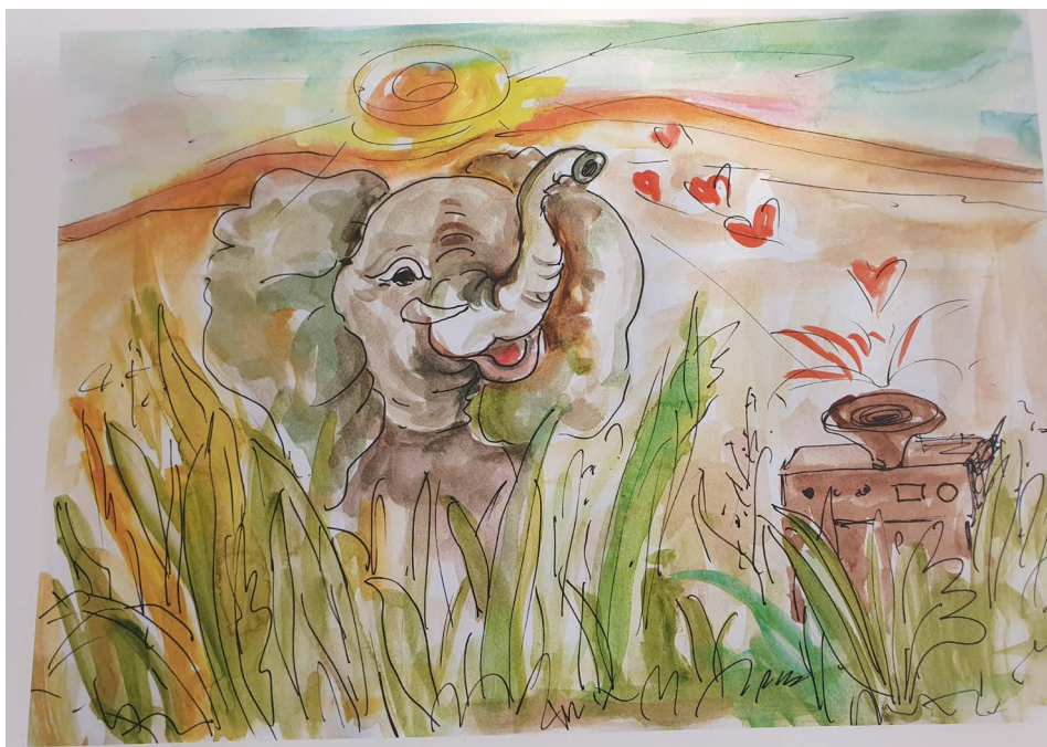
Fotografia 2. Zbiór ilustracji autorstwa Zofii Ślęzak do bajek napisanych przez studentów.