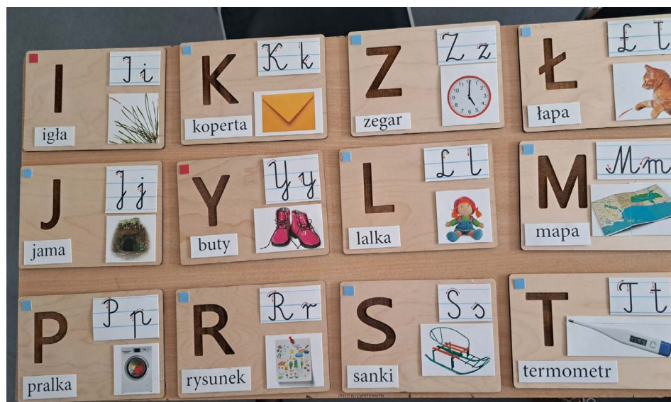
Fotografia 4. „Alfabet sensoryczny”, autor: Weronika Wąs; praca zaprezentowana w czasie spotkań podsumowujących tutoring.