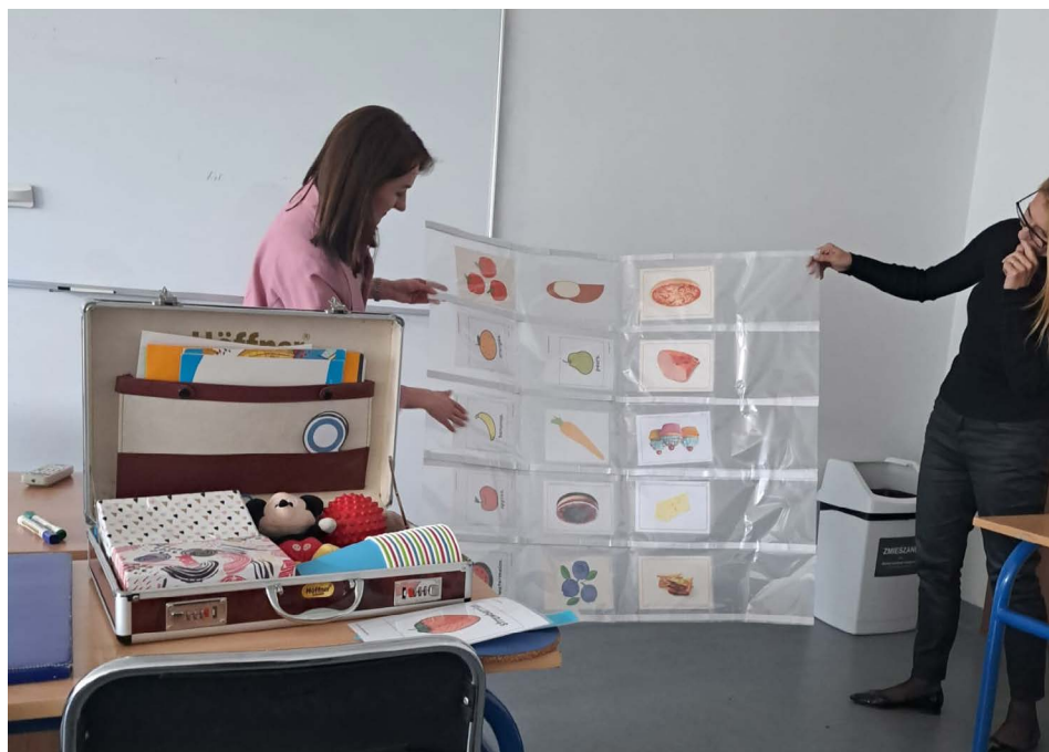
Fotografia 5. „Kreatywny kufer” – zestaw kreatywnych pomocy dydaktycznych, autor: Kamila Kusiak; praca zaprezentowana w czasie spotkań podsumowujących tutoring.