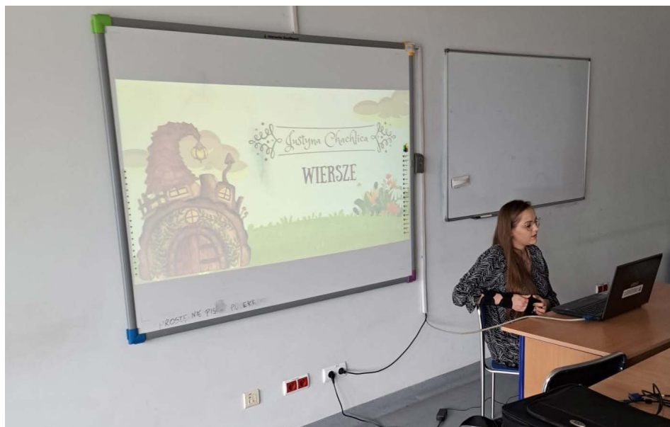
Fotografia 3. „Wiersze autorskie”, autor: Justyna Chachlica; praca zaprezentowana w czasie spotkań podsumowujących tutoring.