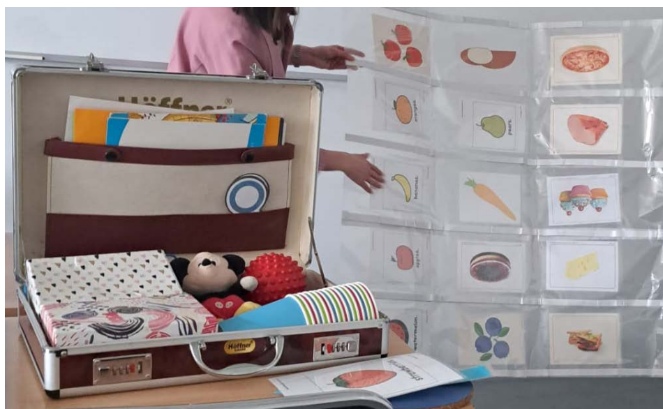
Fotografia 6. „Plansza edukacyjna”, autor: Kamila Kusiak; praca zaprezentowana w czasie spotkań podsumowujących tutoring.