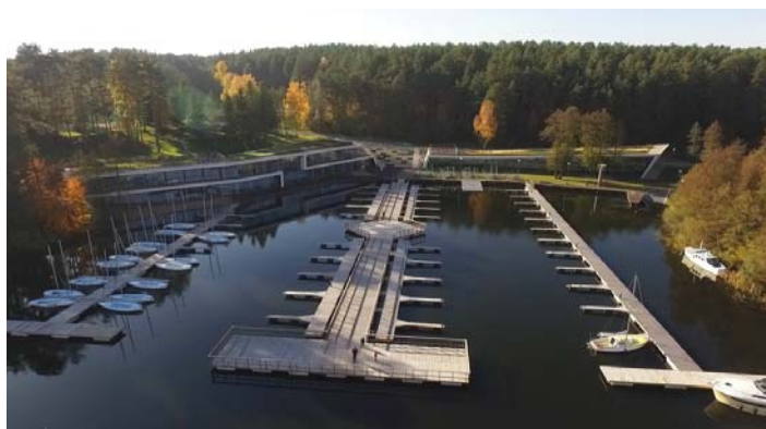
Fot. 3. Centrum Żeglarstwa Wodnego i Lodowego, proj. ReStudio Architektury.