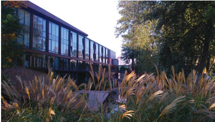
Fot. 5. Hotel Przystań, proj. Dżus GK Architekci.

uważanych za modelowy przykład interwencji architektonicznych w kontekście natury, służących jej podziwianiu i udostępnianiu przy jednoczesnym poszanowaniu miejsca. Można zatem stwierdzić, że architekci odpowiedzialni za projekt nad jeziorem Ukiel faktycznie „z filozofii zaczerpnęli wiedzę o zasadniczych prawach przyrody”, jak postulował Witruwiusz 17 i że „tłumaczą naturę”, jak chciał Pico della Mirandola 18 .