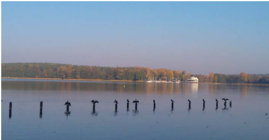
Fot. 1. Kormorany nad jeziorem Ukiel, widok w stronę Olsztyńskiego Centrum Kajakarstwa.

Polodowcowe jezioro Ukiel, zwane dawniej również Jeziorem Krzywym, z uwagi na skomplikowaną linię brzegową jest największym (412 ha) i najgłębszym (43 m) jeziorem leżącym w granicach administracyjnych Olsztyna. Położone w północno-zachodniej części miasta rozciąga się diagonalnie – z północnego zachodu na południowy wschód – na długości ponad 5 km. Jezioro posiada cztery główne zatoki połączone cieśninami, liczne zatoczki i półwyspy. Brzegi są z reguły wysokie, przeważnie strome i zalesione – poza brzegiem południowym i południowo-wschodnim, łagodnym i dogodnym dla plaży oraz przystanią. Linia brzegowa ma ponad 22 km długości. Do jeziora wpływa kilka małych cieków; ma ono też odpływ do rzeki Łyny. Strefę przybrzeżną porasta malownicza trzcina, tatarak i sitowie oraz wierzby płaczące. Nad jeziorem występują liczne gatunki ptaków, m.in.: łabędzie, żurawie, czaple, imponujące rozmiarami kormorany (fot. 1) i kaczki oraz liczne gatunki ryb, także drapieżnych, co świadczy o czystości jeziora.