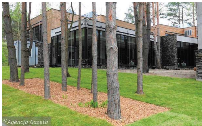
Fot. 4. Olsztyńskie Centrum Kajakarstwa, Studio-Projekt Autorska Pracownia Architektoniczna, fot. z archiwum pracowni, dzięki uprzejmości architektów.