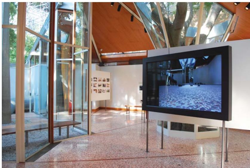
Fot. 2–5. Wnętrze pawilonu Kanady na terenie biennale w Giardini w Wenecji, z fragmentami ekspozycji z 2018 roku, poświęconej historii pawilonu. Przedstawiono m.in. ideę architektoniczną, wynikającą z inspiracji spiralną formą muszli.