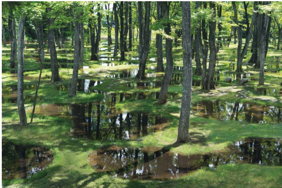
Fot. 7. Yuny'a Ishigami, Ogród Botaniczny Tochigi (2018).