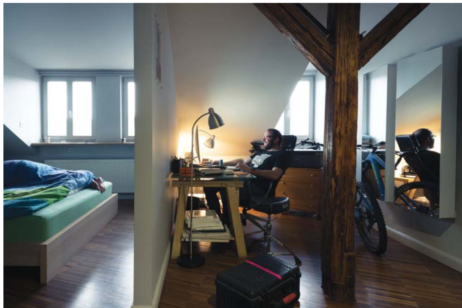
Il. 5. Poddasze – pracownia i sypialnia, proj. Emilia Malec-Zięba.