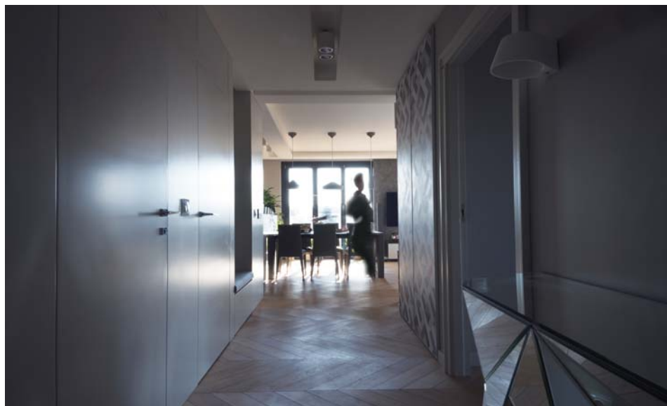
Il. 8. Apartament – hall, proj. Emilia Malec-Zięba.