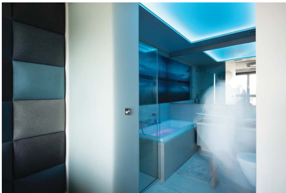
Il. 9. Apartament – łazienka, proj. Emilia Malec-Zięba.