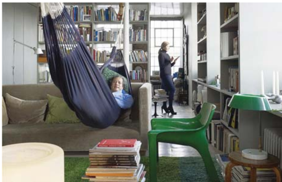
Il. 2. Wnętrze domu Ilse Crawford.

Ulubione słowo Ilse Crawford: frame – rama, struktura – to swego rodzaju podstawa, baza dająca punkt wyjścia do dalszych działań, pozwalająca na dodanie pierwiastka własnej osobowości do wnętrza, na możliwość zmian, na przypadkowość, a także na swobodne dopasowanie się wnętrza do użytkownika.