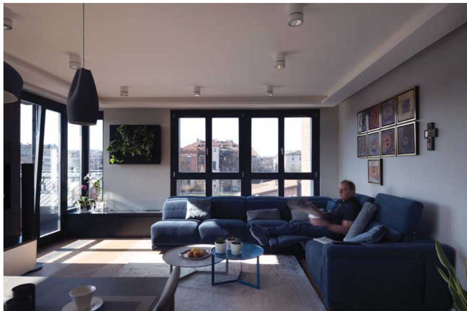
Il.7. Apartament – pokój dzienny, proj. Emilia Malec-Zięba.