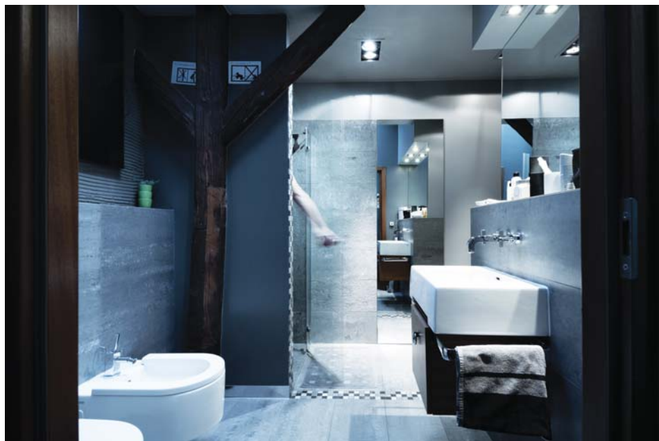
Il. 6. Poddasze – łazienka, proj. Emilia Malec-Zięba. Fot. M. Massa Mąsior.