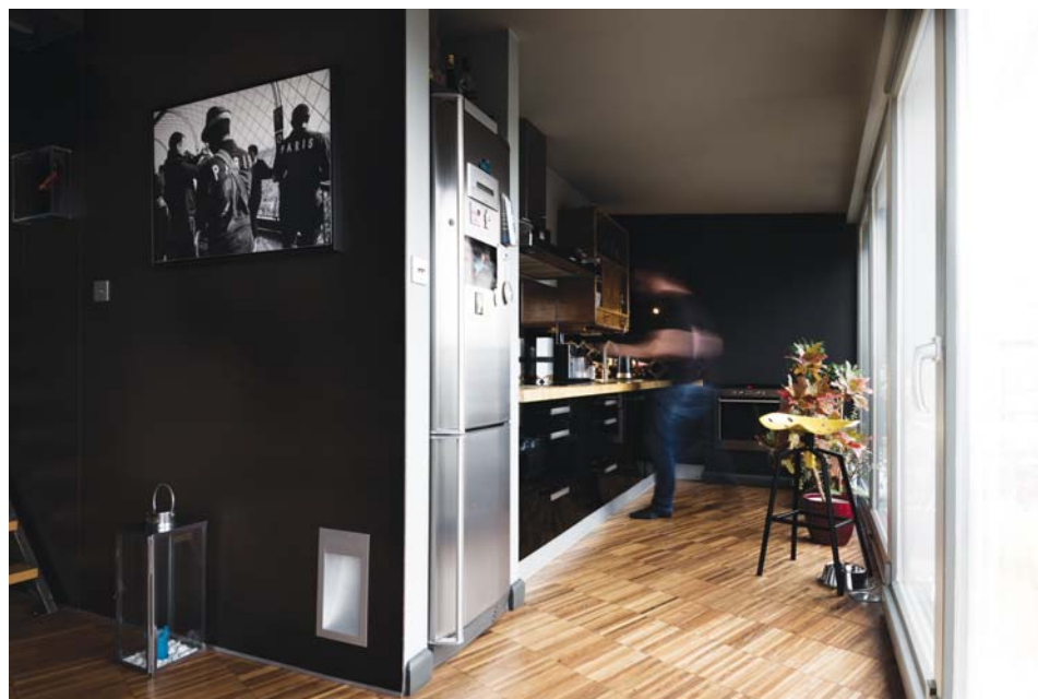
Il. 4. Poddasze – kuchnia, proj. Emilia Malec-Zięba.