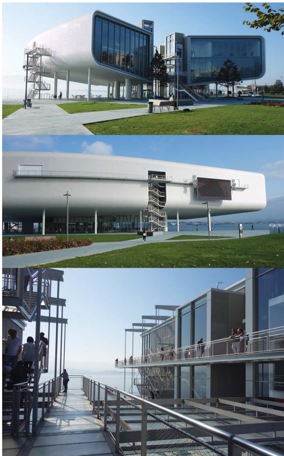
Il. 1. Santander, Centrum Botín proj. Renzo Piano.