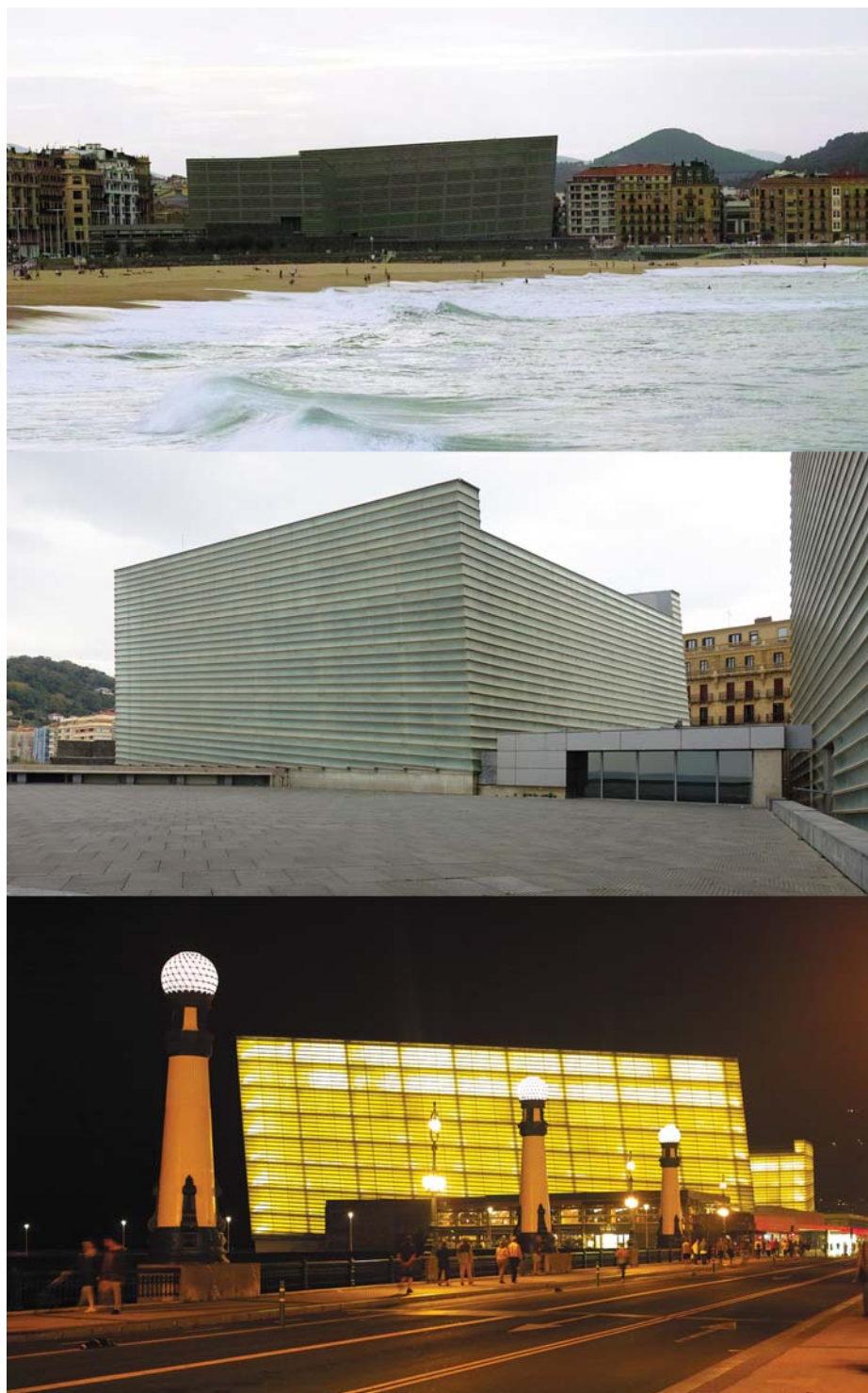
Il. 3. San Sebastián, Pałac Kongresowy i Audytorium Kursaal, proj. Rafael Moneo.