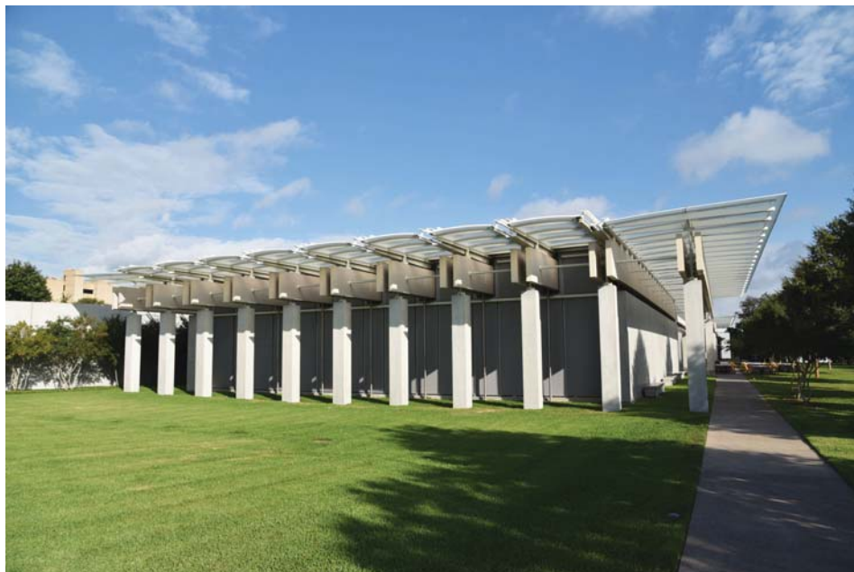
Il. 11. Kimbell Art Museum, pawilon muzealny Renzo Piano 2012.