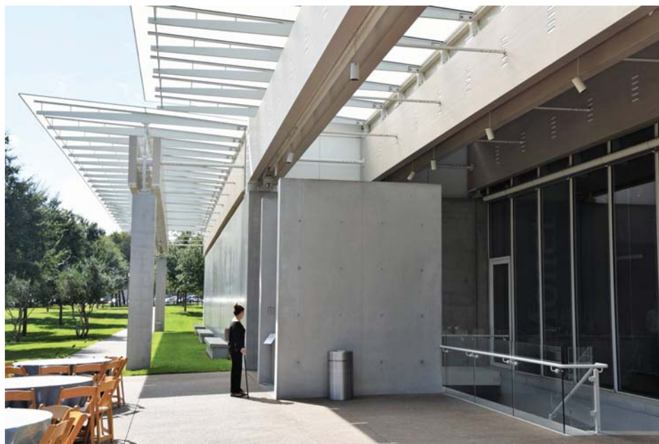
Il. 13. Wejście główne do pawilonu Piano.