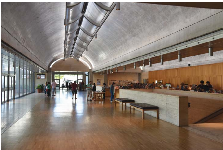
Il. 7. Kimbell Art Museum: hall wejściowy i sklep muzealny, w głębi widoczny dziedziniec i stojąca na nim rzeźba L'Air autorstwa Aristide'a Maillola.