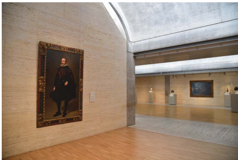
Il. 9. Wnętrze Kimbell Art Museum, na pierwszym planie portret Don Pedro de Barberana Diego Velázquez, ok. 1631–1633.