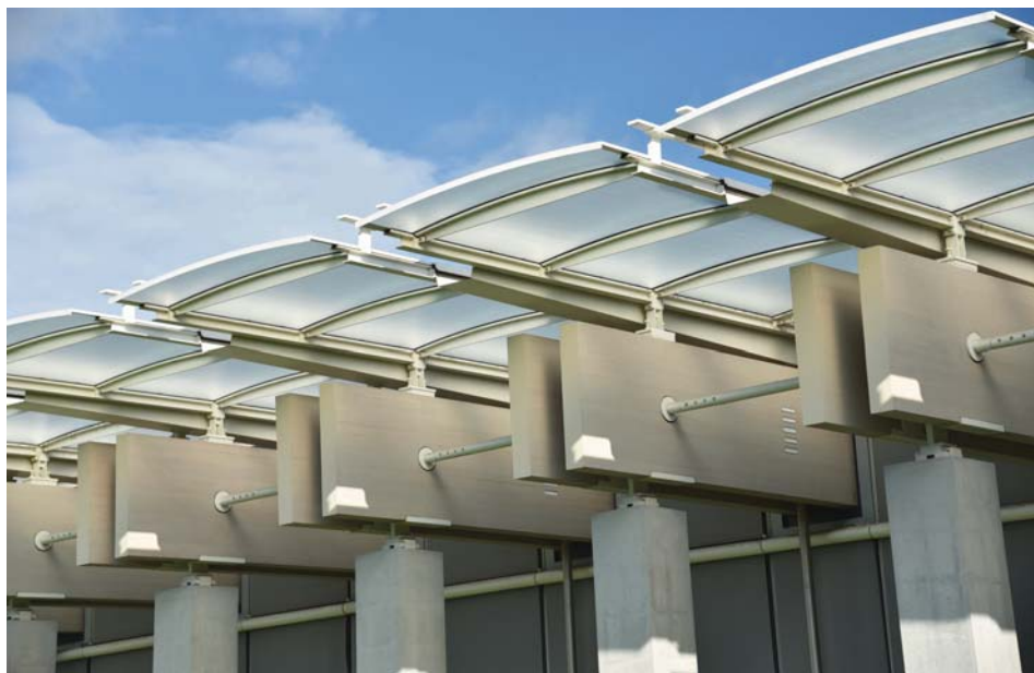
Il. 16. Pawilon Piano – detal dachu.