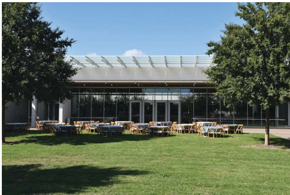
Il. 12. Pawilon Renzo Piano widziany sprzed wejścia do budynku Louisa Kahna.