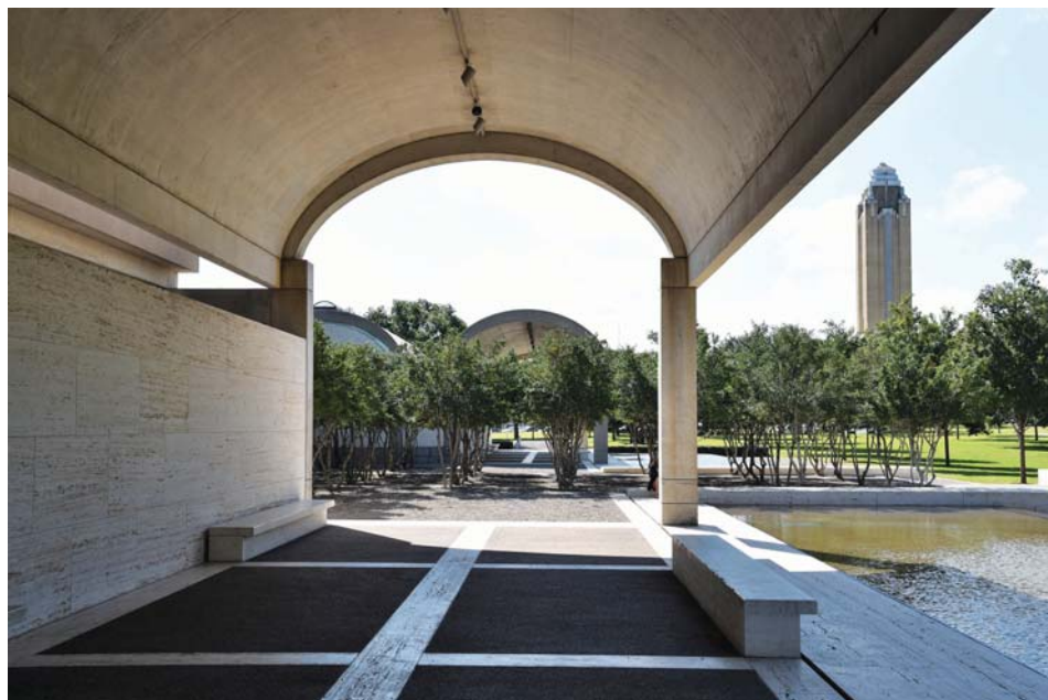
Il. 3. Portyk i porośnięty mirtem plac przed wejściem do Kimbell Art Museum, w głębi widoczna wieża Will Rogers Center.