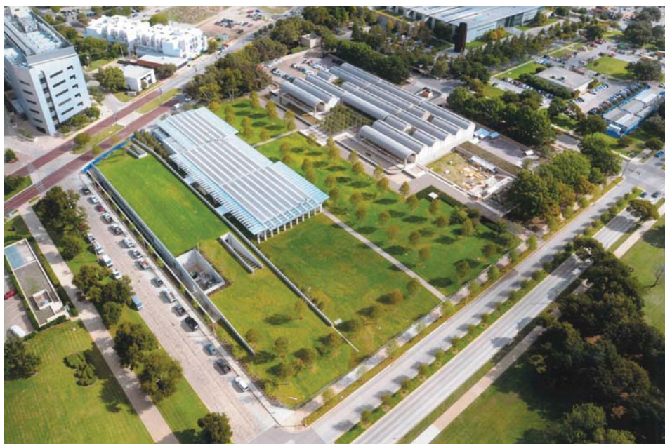
Il. 1. Kimbell Art Museum widziane z lotu ptaka, po prawej budynek Louisa Kahna, po lewej na dole pawilon Renzo Piano.