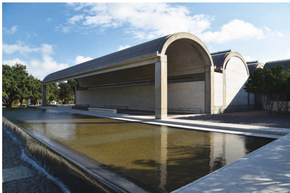
Il. 2. Kimbell Art Museum, proj. Louis Kahn, 1972.