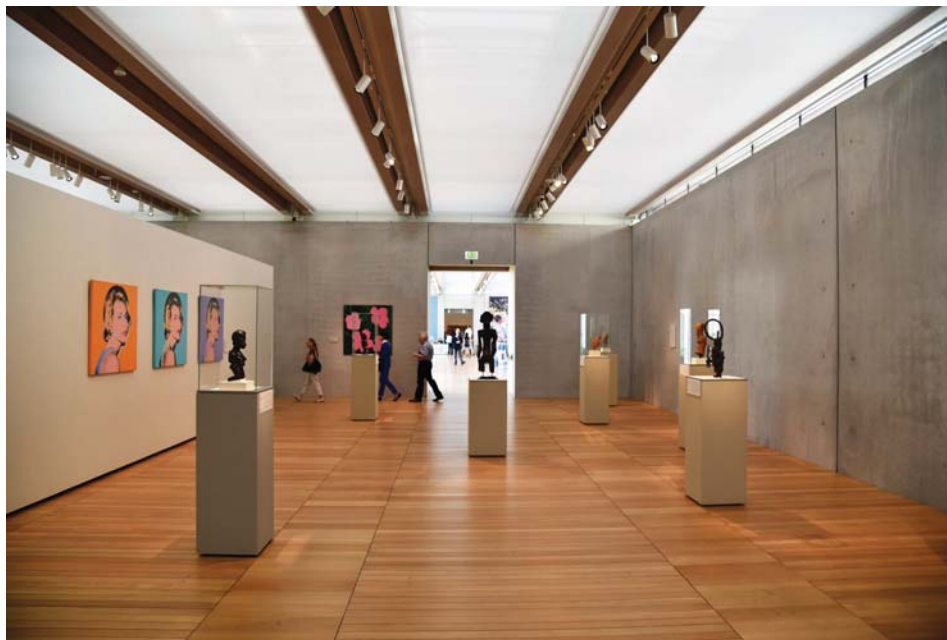
Il. 15. Pawilon Piano – doświetlona rozproszonym światłem dziennym galeria wystaw czasowych.