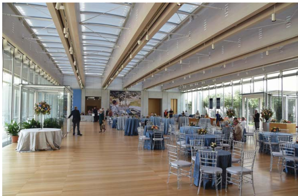
Il. 14. Hall wejściowy w pawilonie Piano w głębi galeria wystaw czasowych, po prawej przejście do audytorium – trwają przygotowania do wernisażu wystawy czasowej Claude'a Moneta.