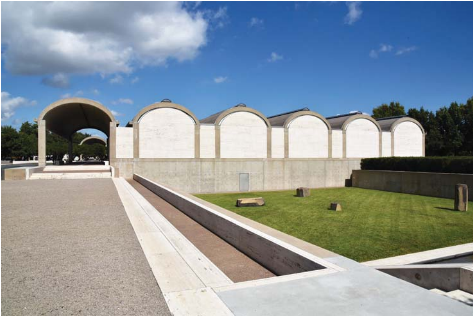
Il. 4. Widok ogólny na bryłę muzeum, w dole trawiasty dziedziniec z instalacją rzeźbiarską Constellation Isamu Noguchiego (1980–1983). Fot. A. Jasiński.

wnętrz doświetlonych pośrednim światłem dziennym, w których stale odczuwalne będą zmiany pogody, położenia słońca i barwy światła.