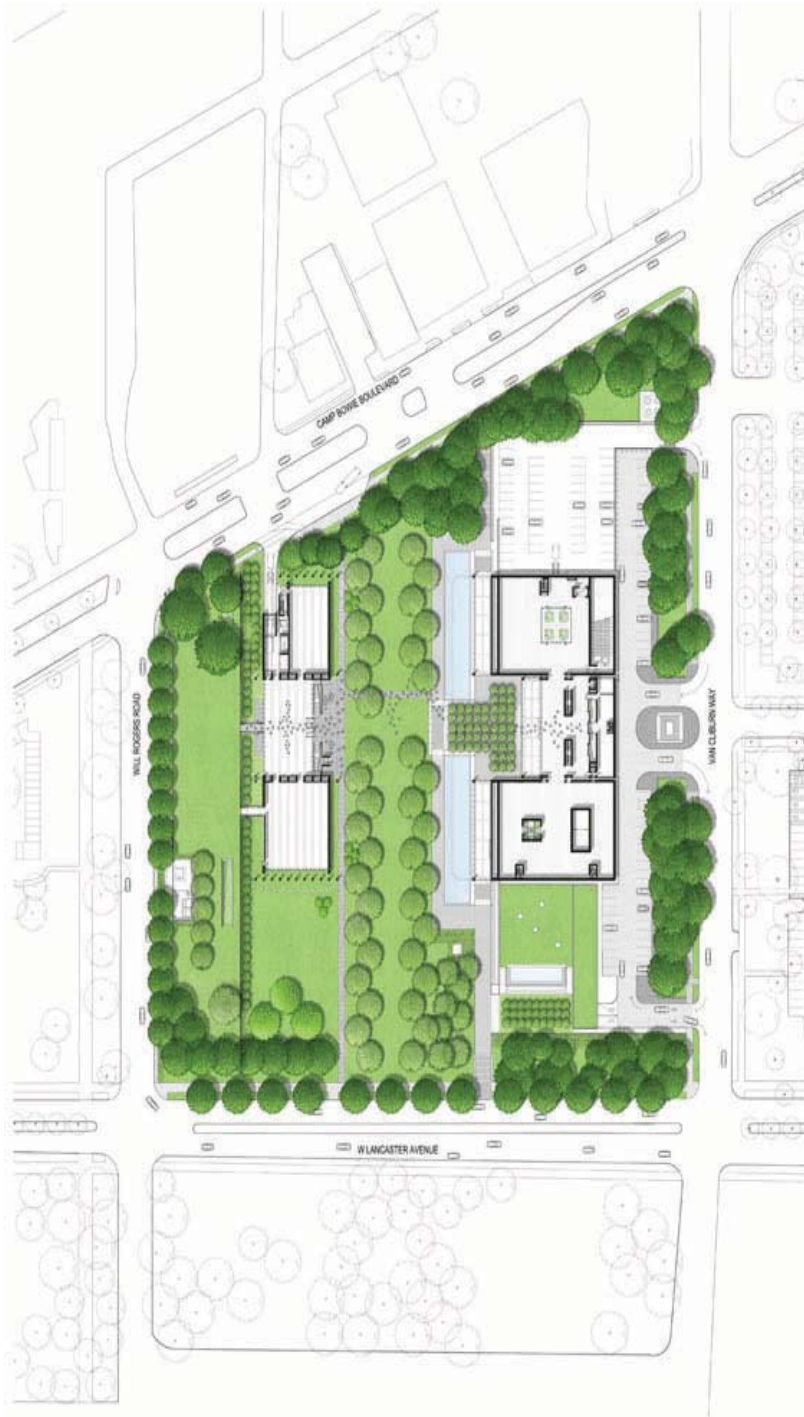
Il. 10. Plan sytuacyjny: po prawej budynek Louisa Kahna, po lewej pawilon Renzo Piano.