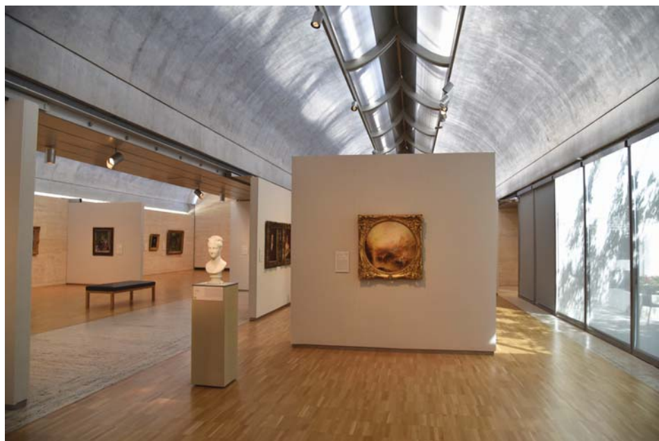
Il. 8. Kimbell Art Museum: wnętrze galerii.