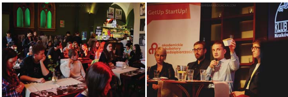
Fot. 2–3. Spotkanie ze krakowskimi startup-owcami zorganizowane przez studentów

Inwencja studentów dotycząca warunków zaliczenia bywa zaskakująca, zarówno w kwestii rozmachu, jak i stopnia ich zaangażowania. Na ćwiczeniach z ekonomii grupa studentów zaproponowała, że zorganizuje spotkanie z praktykami biznesu, na które zaprosi kolegów i koleżanki z roku, swoich znajomych oraz wszystkie zainteresowane osoby. Zaproponowanym tematem spotkania była działalność startup-owa. Lista zaproszonych prelegentów została skonsultowana z prowadzącą kurs, ale całość organizacji zdarzenia, łącznie z wyborem i zaproszeniem gości (młodzi, krakowscy star-upowcy, przedsiębiorcy), rezerwacją sali (Klub pod Jaszczurami) oraz akcją promocyjną, spoczęła na pomysłodawcach spotkania. Temat oraz plan spotkania okazał się na tyle ciekawy, że studencki projekt został objęty patronatem Akademickiego Inkubatora Przedsiębiorczości UJ, co podniosło rangę całego zdarzenia (fot. 2.).