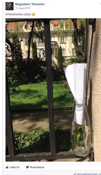
Fot. 6–7. Gry terenowe