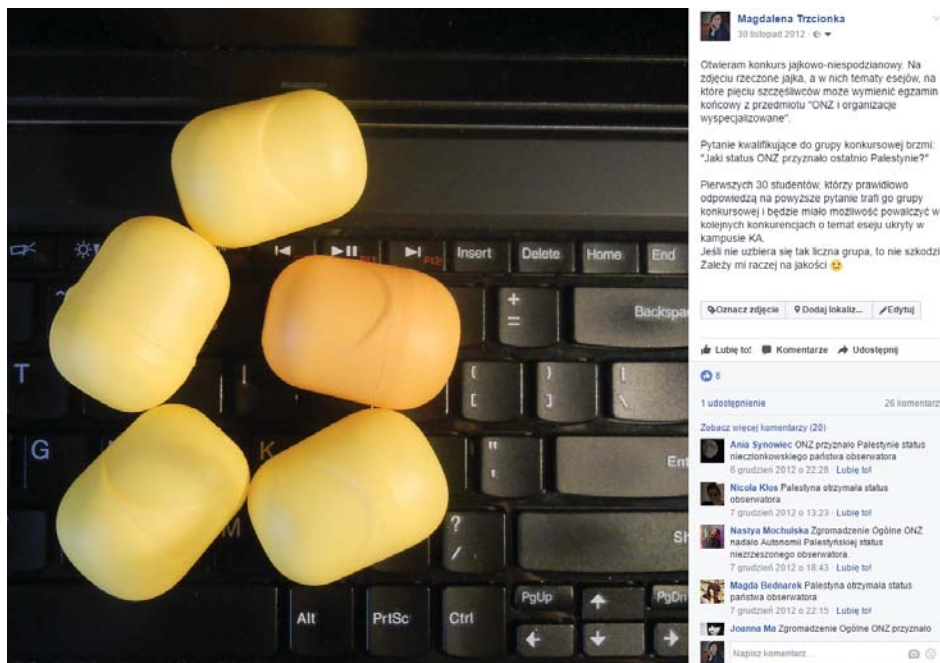
Fot. 1. I etap gry o temat eseju zaliczeniowego